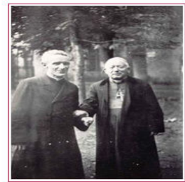
Mgr de Solages et Mgr Saliège

Dès mars 1941, Il agit pour aider les détenus majoritairement juifs des camps de Noé (Haute-Garonne) et de Récébédou. Le 23 août 1942, il fait lire dans les paroisses de son diocèse une lettre pastorale où il dit que « Les Juifs sont des hommes, les Juives sont des femmes (...) ils font partie du genre humain ; ils sont nos frères comme tant d'autres ; un chrétien ne peut l'oublier ». Il place également de nombreux Juifs dans des lieux sûrs aux alentours de Toulouse, au risque de se faire arrêter par la Gestapo le 9 juin 1944 .