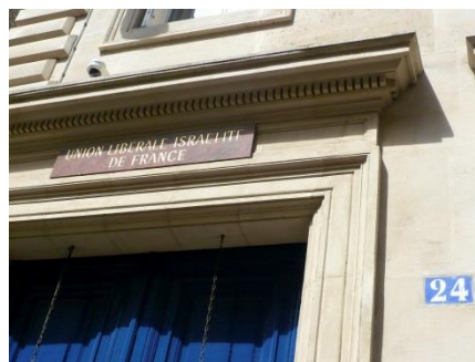
Façade de la synagogue ULIF Copernic