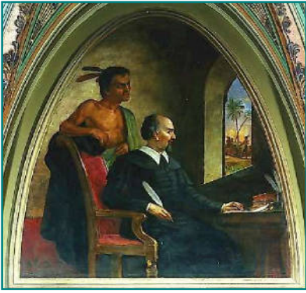
Bartolomé de Las Casas, par C. Brumidi (1876).

Un «nouveau chrétien» au secours des Indiens d'Amérique