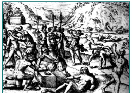
Gravure extraite de Spanish Cruelties de Las Casas, (édition anglaise de 1609).