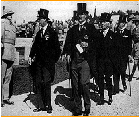
La Commission Peel