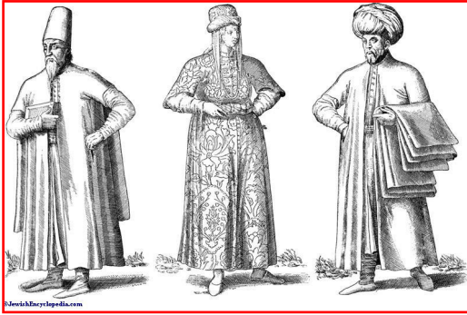
Juifs de l'Empire ottoman en costumes traditionnels