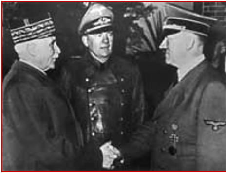
Le Maréchal Pétain et Adolph Hitler à Montoire le 24 octobre 1940