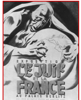
Affiche de l'Exposition Le Juif et la France

12 décembre : rafle de 700 notables Juifs à Paris.