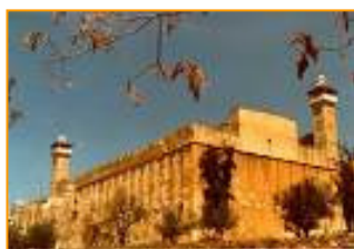
Tombeau des Patriarches à Hébron

Les contours de la Cisjordanie correspondent, en grande partie, aux territoires bibliques de Judée-Samarie ( Yehuda véShomron ), nom sous lequel la région est administrée par Israël, signifiant ainsi le lien historique entre l'identité juive et cette entité géographique.