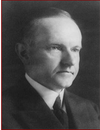
Calvin Coolidge, président des Etats-Unis (1923-1929), signataire de la loi Johnson-Reed