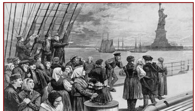
L'arrivée d'immigrants à New York – le début de l'espoir

• En 1978, le Congrès a décidé d'abandonner le système de quotas par hémisphère et a adopté un plafond au niveau mondial, ce qui élargit d'avantage la diversité de l'origine des arrivants.