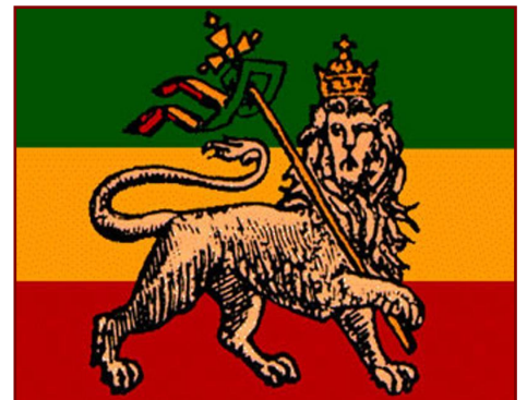
Le Lion de Juda alias Haïlé Sélassié

• En tant que Ras Tafari (celui qui est redouté en amharique), il exerce le pouvoir sous le règne de sa cousine l'impératrice Zaoditou, puis comme roi de 1928 à 1930. À la mort de Zaoditou, il prit le titre d'empereur. Il fut couronné le 2 novembre 1930 sous le nom de « Haïlé Sélassié Ier (pouvoir de la Trinité), Roi des Rois d'Éthiopie, Seigneur des Seigneurs, Lion conquérant de la tribu de Juda, Lumière du Monde, élu de Dieu »