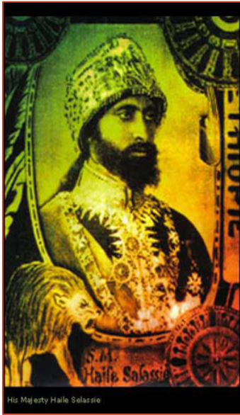
Le dernier empereur d'Éthiopie, Haïlé Sélassié I, le « lion conquérant de la tribu de Juda », connu sous le nom qu'il portait avant d'être couronné, soit Ras (prince) Tafari, le considérant comme l'élu de Dieu, le messie et le champion de la race noire.