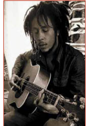
Bob Marley (à droite) reprinted le discours d'Haïlé Sélassié en 1963 aux Nations-Unies dans la