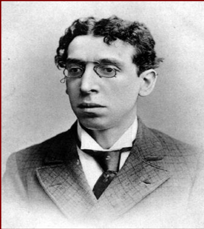
Israël Zangwill (1864-1926)