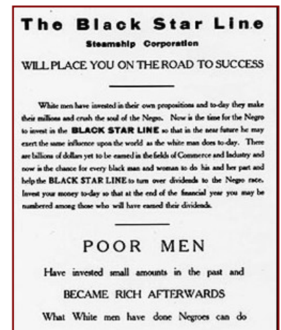
Un tract de la Black Star Line

• Le 2 novembre 1930, en Ethiopie, Tafari Makonnen est coiffé de la couronne sacrée du Négusa Negast (roi des rois) sous le nom de Haïlé Sélassié Ier. Selon le livre Gloire Des Rois (Kebra Nagast) , Sélassié est le descendant direct du Roi Salomon et de la Reine de Saba. Les rastas voient en ce couronnement l'accomplissement de la prophétie de Garvey.