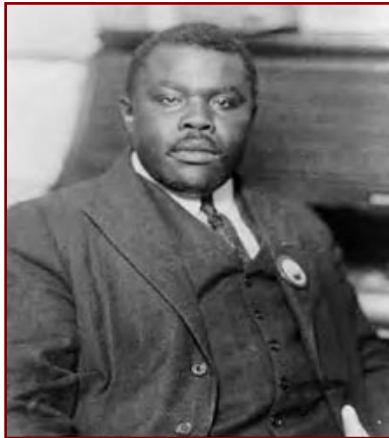
Le prophète rasta