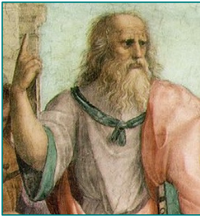
Platon selon Raphaël, détail de l'École d'Athènes