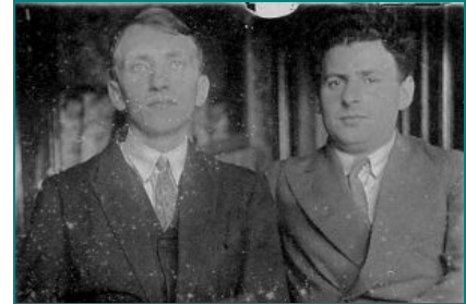
Maurice Blanchot et Emmanuel Lévinas

Lors de la première guerre mondiale, la poussée allemande conduit la famille à fuir jusqu'à Kharkov (Russie) où, en dépit du numerus clausus , Emmanuel Lévinas intègre le lycée. Mais les manifestations anti-sémites poussent la famille à retourner en Lituanie (1920).