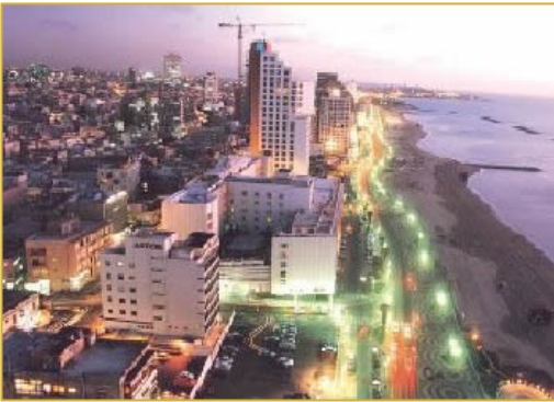
La plage de Tel Aviv