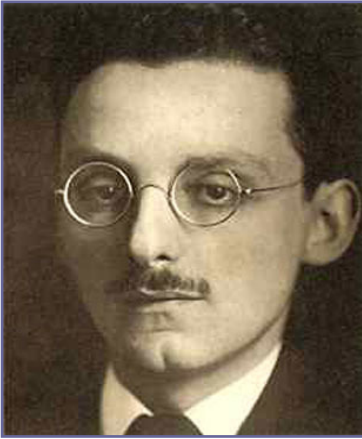
Max Brod (1884-1968)