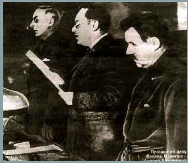
Le procureur général Vynchinski lisant le verdict du procès Centre antisoviétique trotskyste de réserve en janvier 1937 (procès de Radek)