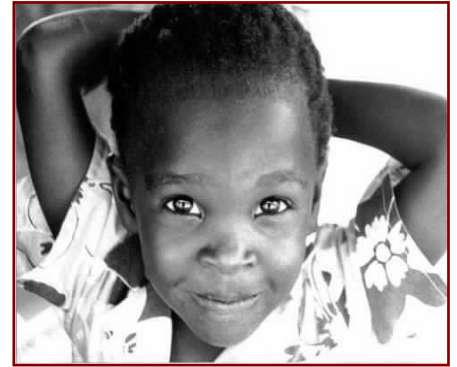
Un petit garçon Abayudaya

• Après le décès de Kakungulu, le nombre d'Abayudaya était descendu à 300. L'établissement de contacts avec des organisations juives à partir des années 1960 permirent aux Abayudaya de sortir de leur isolement. La World Union for the Propagation of Judaism (créée en 1955 par Israel Ben-Zeev, professeur à l'Université Bar-Ilan) s'intéressa ainsi aux Abayudaya: elle y voyait un point de départ possible pour des efforts de conversion d'Africains au judaïsme.