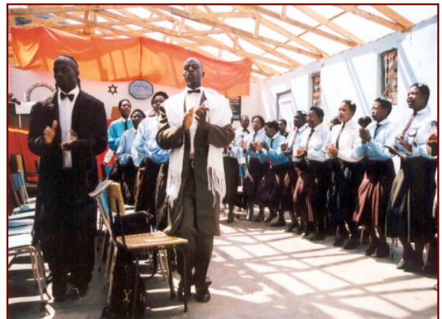
La communauté juive de Rusape dans leur temple

• Aujourd'hui, la communauté juive de Rusape, forte de plusieurs milliers de personnes vit sa foi dans un temple récemment reconstruit, situé à environ sept kilomètres de la ville. Ces Juifs respectent les règles de la cacheroite, suivent les mêmes fêtes que celles des Occidentaux et apprennent l'hébreu.