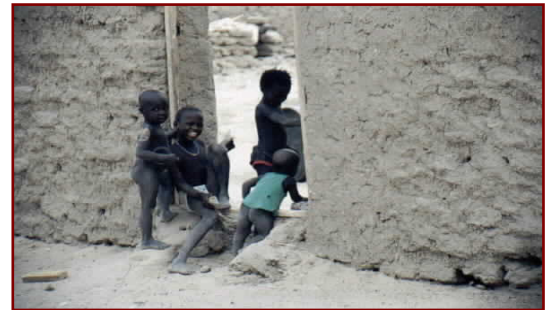
Des enfants dans les rues de Tombouctou (Mali)

• Les Juifs étaient des nomades parmi les plus résistants, au moins ceux qui venaient commercer jusque dans les centres éloignés comme Tombouctou. Tous les Juifs de Tombouctou se convertirent tardivement soit à l'Islam soit au Christianisme. Des recherches historiques récentes ont amené plusieurs familles dans cette ville malienne éloignée pour retrouver la religion de leurs ancêtres.