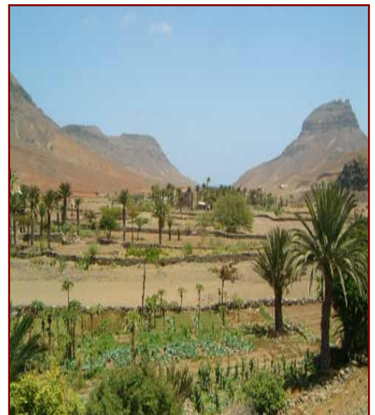
Le Cap Vert devient une colonie portugaise à partir de 1456, et voit l'arrivée des premiers colons sur l'archipel alors inhabité. Il s'agit notamment de juifs espagnols et portugais fuyant l'Inquisition.

• L'histoire de la communauté juive du Cap Vert est liée à l'Inquisition portugaise et à l'esclavage. Dans les années 1460, quand les portugais découvrirent les quatorze îles situées à 450 kilomètres de la côte de l'Afrique occidentale, ils utilisèrent l'archipel comme une station de ravitaillement sur la route du Nouveau Monde, comme une escale pour la traite, où ils pourraient aussi se ravitailler en combustible. C'était aussi un refuge pour des Juifs que l'Inquisition cherchait à convertir sous peine de mort.