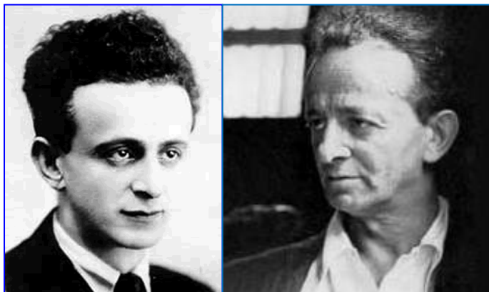
Itzik Manger (1901-1969)