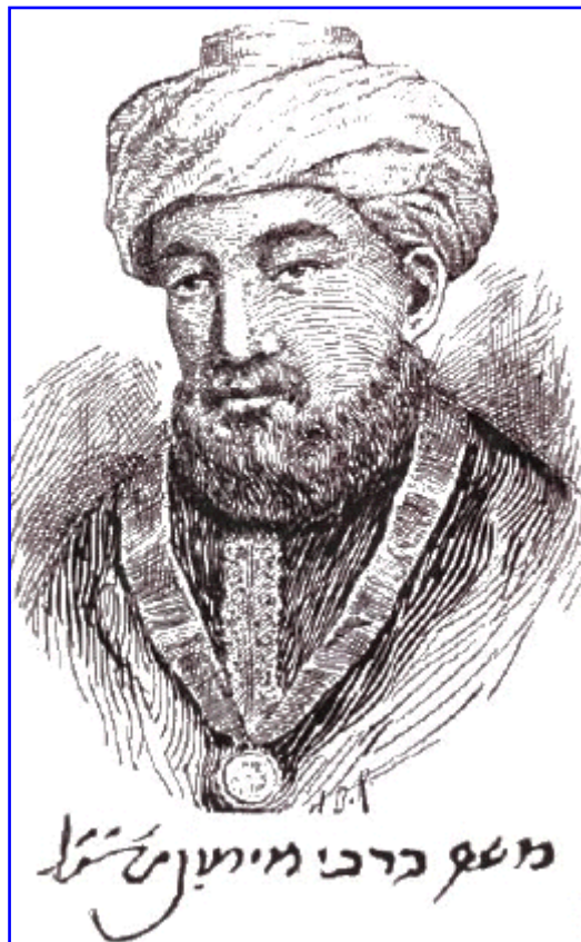
Portrait de Maïmonide.