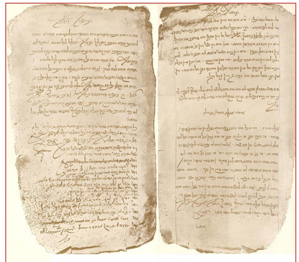
Page du livre des registres du Conseil (recto et verso).

Sous l'impulsion du Va'ad, les communautés adoptent un système d'enseignement généralisé qui fait de la Pologne une pépinière de talmudistes pour des générations.