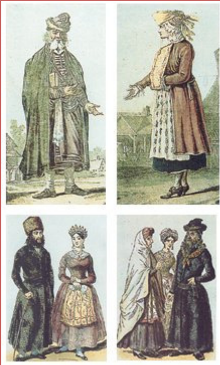
Judaïsme polonais, vers 1580