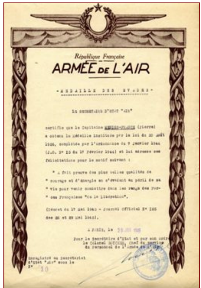
Document de l'armée de l'air qui remercie Pierre Mendès France de s'être évadé de prison pour rejoindre les Forces Françaises Libres