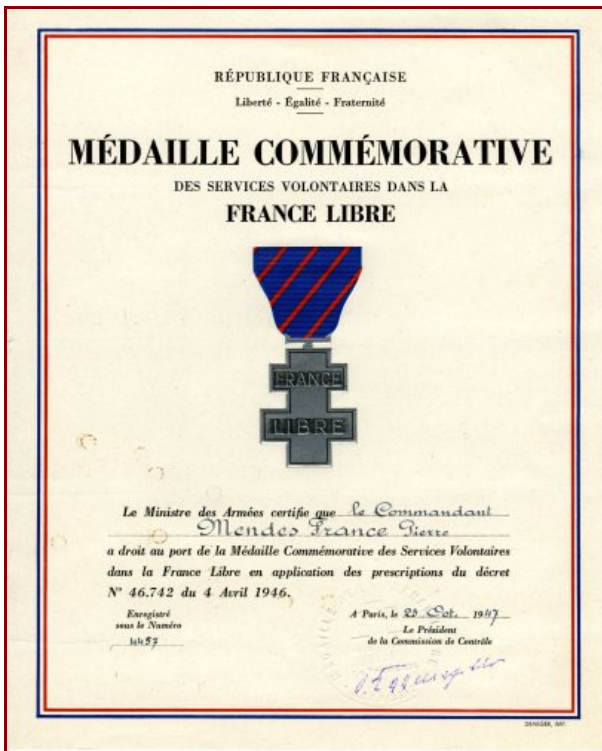
La médaille commémorative des services volontaires dans la France Libre remise au Commandant Pierre Mendès France