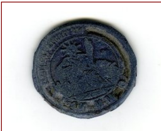
Le tampon qui a servi à Mendès France pour fabriquer de faux papiers et rejoindre Londres