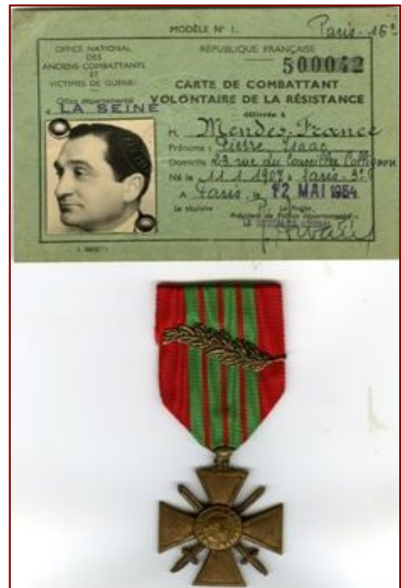
La carte de combattant volontaire de la Résistance