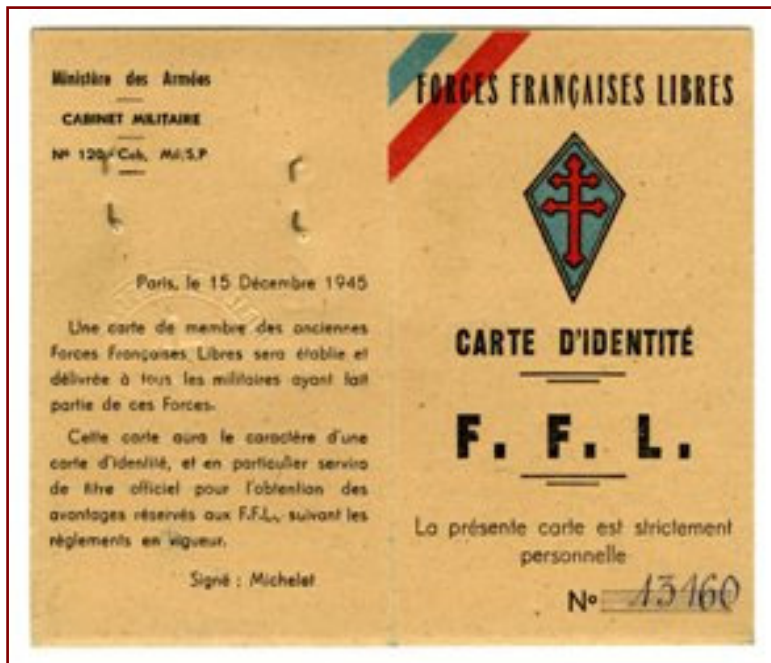
La carte des Forces Françaises Libres de Mendès France (recto)