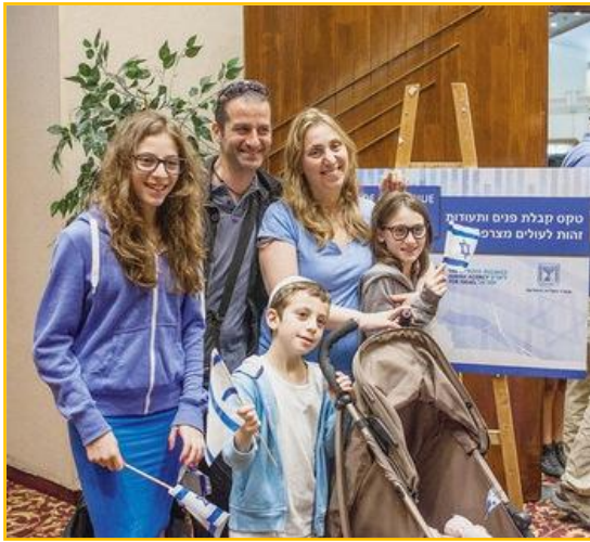
Une famille française lors de la remise des cartes d'identité à Jérusalem en juillet 2014.