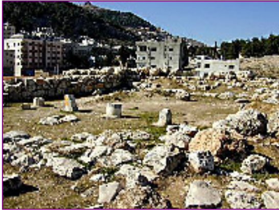
La Sichem biblique au pied de Naplouse

Ramban considère que seul Sichem était coupable et non toute la population mâle.