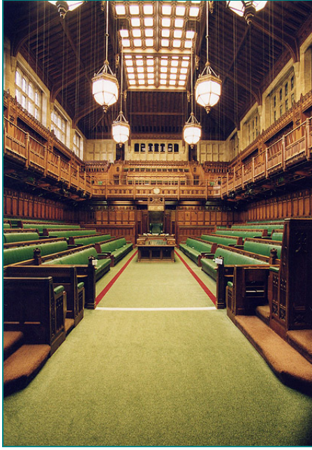
La Chambre des Communes