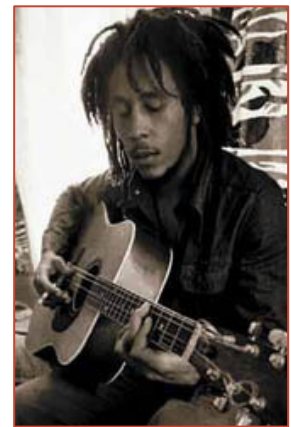
Bob Marley (à droite) reprend le discours d'Haïlé Sélassié en 1963 aux Nations-Unies dans la chanson War