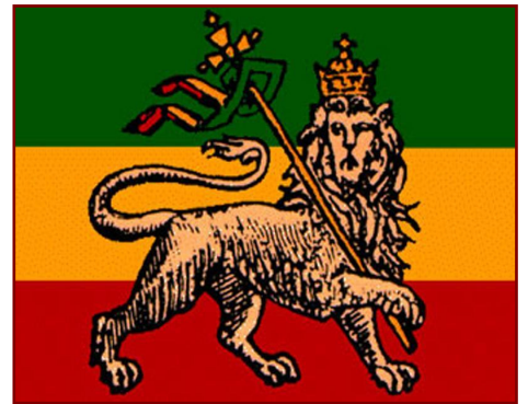
Le Lion de Juda alias Hailé Sélassié