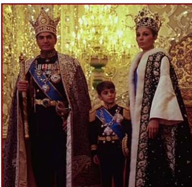
Mohammad Reza Pahlavi, sa femme Farah Diba et leur fils Reza

• Sous le règne du Shah Pahlavi, l'Iran accélère sa modernisation : chemins de fer, industrialisation. Le Shah crée la première université moderne de Téhéran (1934), instaure les noms de famille et le livret d'état civil , modernise la justice et l'armée et entreprend un effort considérable pour moderniser le système éducatif. En 1935, il interdit le port du voile pour les femmes et oblige les hommes à porter un habit "à l'occidentale" .