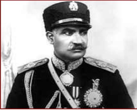
Reza Shah Pahlavi (1877-1944)