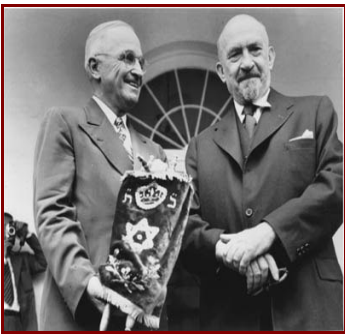
Weizmann et Truman (1948)

Weizmann continua à jouer un rôle crucial pour lever des obstacles sur la voie de l'indépendance. En 1947, lorsque les Britanniques déposèrent le problème de la Palestine devant les Nations unies, il s'adressa à l'Assemblée générale, appelant les délégués à avoir à l'esprit leur "mission historique" ; ainsi, un intense travail de pressions exercées en coulisses y compris celui de Weizmann fut un facteur déterminant dans la décision de l'Assemblée générale d'inclure le Néguev dans le territoire destiné à l'Etat juif en vertu de la résolution de partage de l'ONU. Cette résolution fut adoptée le 29 novembre 1947 par un vote de 33 voix pour, 13 voix contre et 10 abstentions.