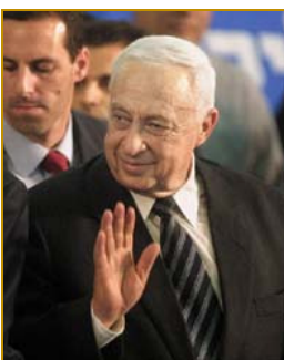
Ariel Sharon (1928- ), ministre de la défense

15 septembre : le ministre de la défense Ariel Sharon rencontre le commandant en chef de Tsahal, le général Raphaël Eytan.