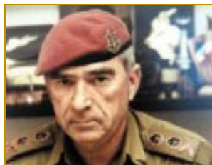
Commandant en chef de Tsahal, Rapahel Eytan (1926-)

On découvre que les Phalangistes ont tué, outre des combattants palestiniens, des civils en grand nombre.