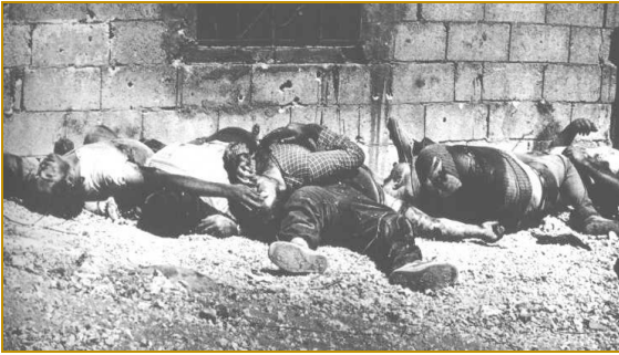
Photo du massacre de Sabra et Chatila

A la suite des massacres commis à Sabra et Chatila, le gouvernement d'Israël décide le 28 septembre 1982 de créer une commission d'enquête. Cette commission était composée de trois membres : le président de la Cour suprême, le juge Kahane; le juge Aharon Barak, et le général de réserve Yona Efrat, assistés par une équipe de juristes de haut niveau. La commission Kahane a remis le 8 février 1983 un rapport, long et détaillé.