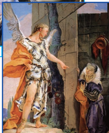
Sara et l'ange (détail), Giambattista TIEPOLO, fresque (1726-29), Palazzo Patriarcal, Udine.

Dimanche 12 mars 2017, de 14 h 00 à 18 h 30 au Cercle Bernard Lazare 10 rue Saint-Claude Paris 3 e