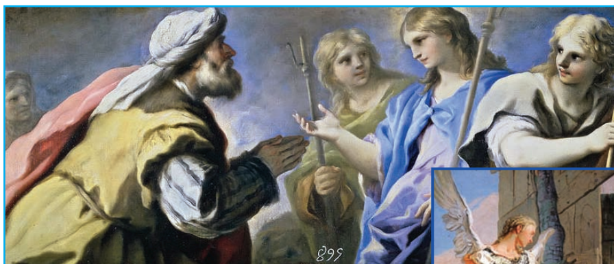
Abraham et les trois Anges (détail), Luca GIORDANO, huile sur toile (1676).